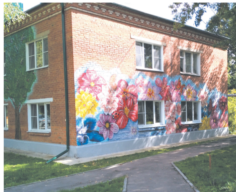
Гриффити и сказочные персонажи на ул. Школьной