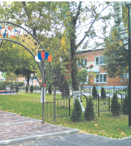
ива «Волшебное дерево»