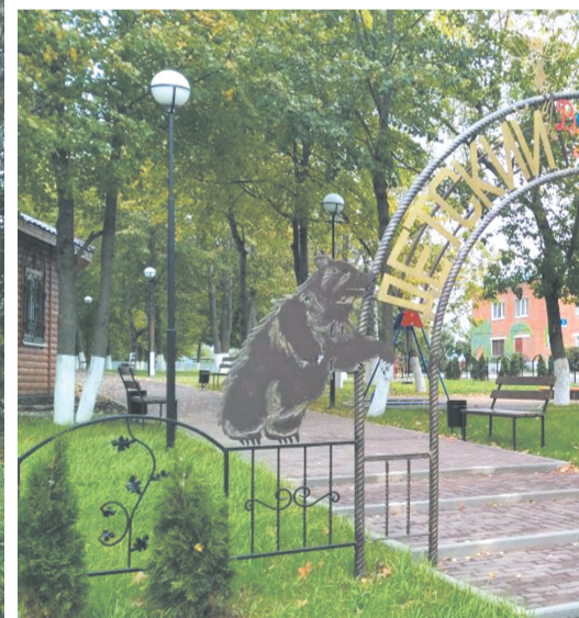
«Народный парк» по месту жительства