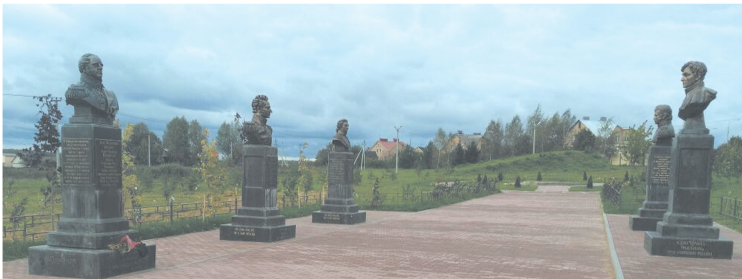
Парк имени В.Д. Корпачевой приобретает цивилизованный вид. Осталось только подрасти деревьям.