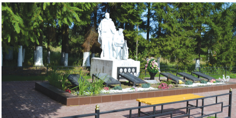
Девять памятников Боевой Славы были благоустроены в 2016 году